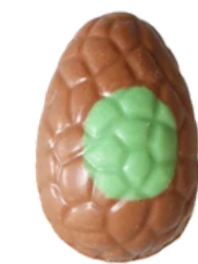
lait pistache Dubai