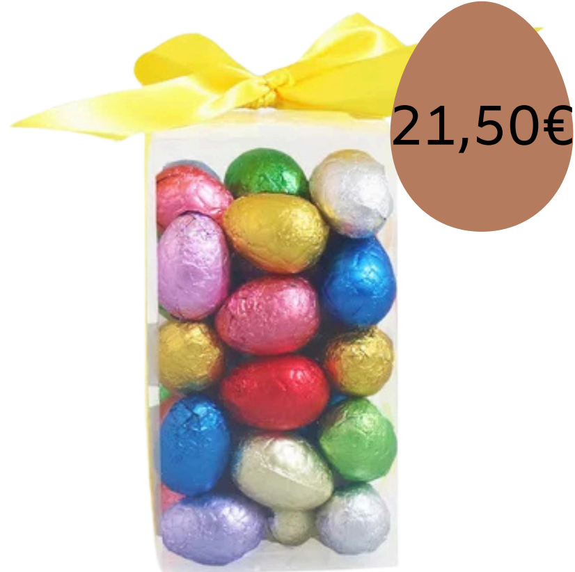
Le mélange des petits oeufs emballés (420gr)