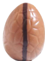
lait mousse au chocolat