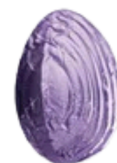
crème au beurre café