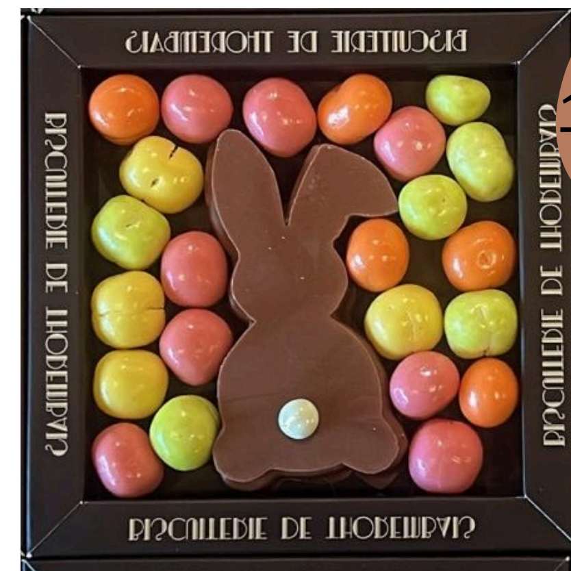
Le lapin et ses amandes enrobées