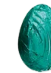
lait vanille crème