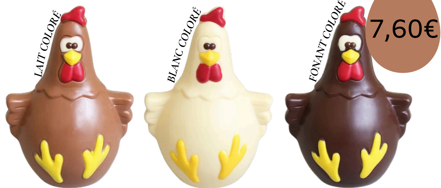
La poulette (13cm)