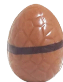
lait caramel au beurre