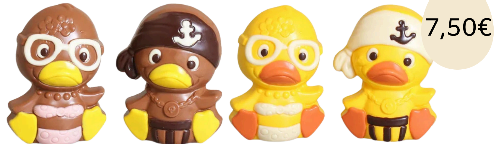
Le petit canard (11,5cm)