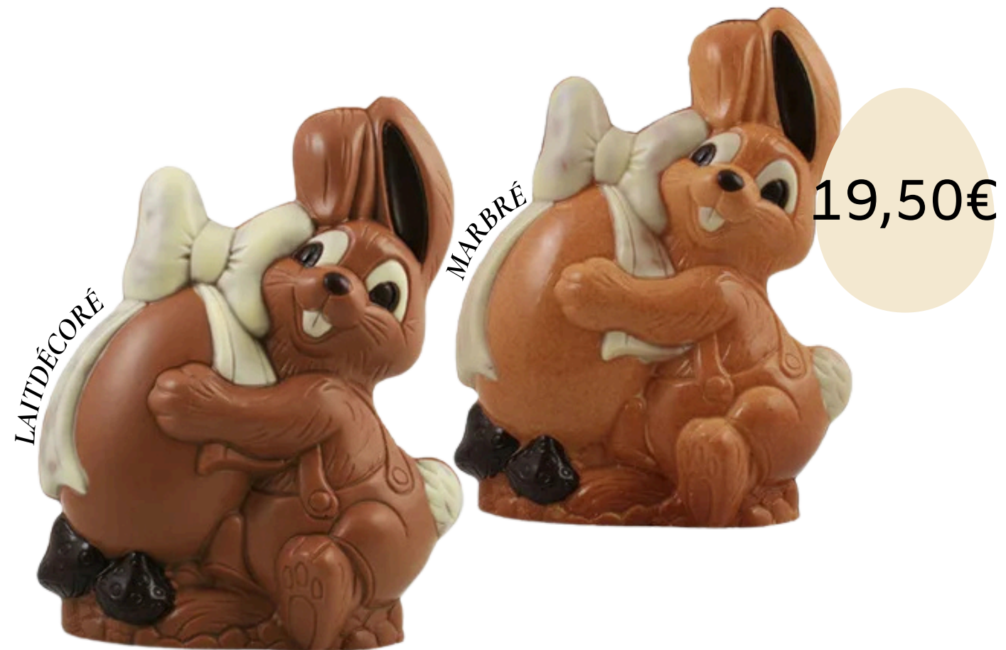
Le lapin et son oeuf (21cm)