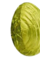
lait praliné crispy