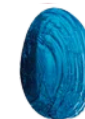
fondant vanille crème