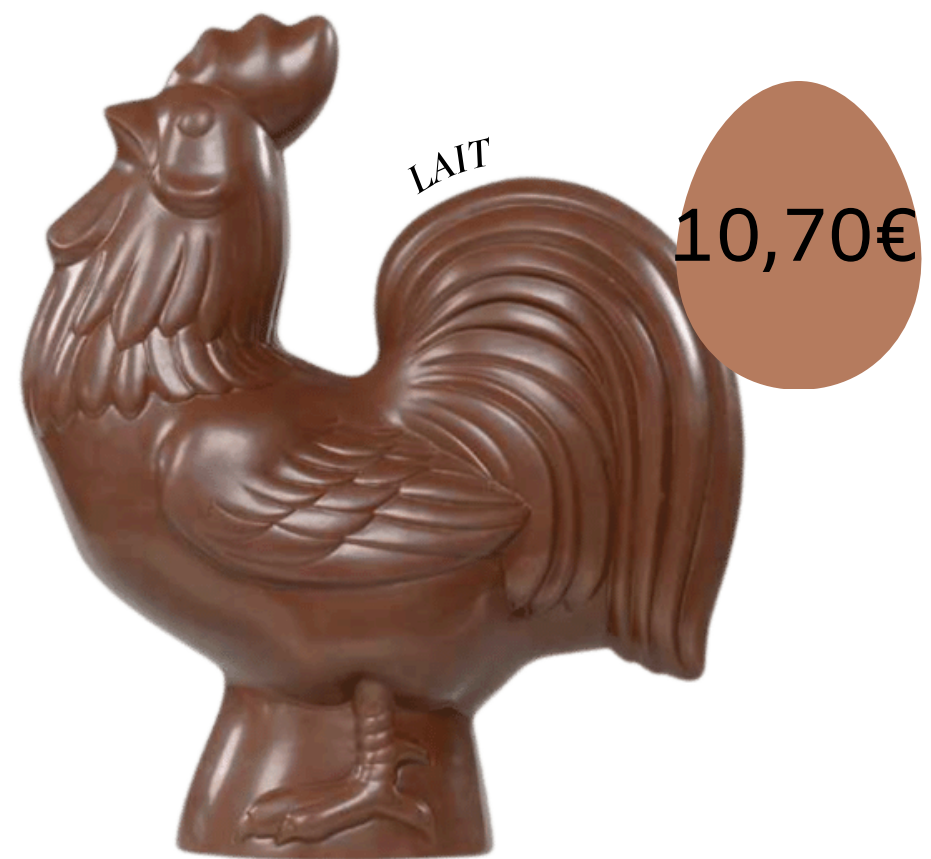
Le coq (17cm)