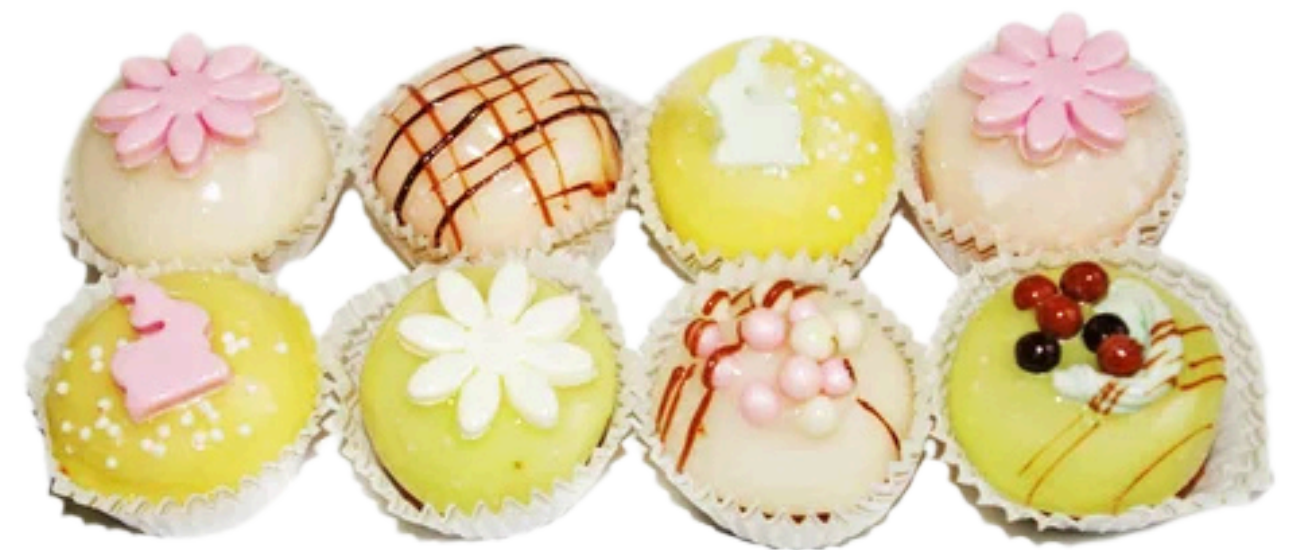
Les petits fours (8pcs)