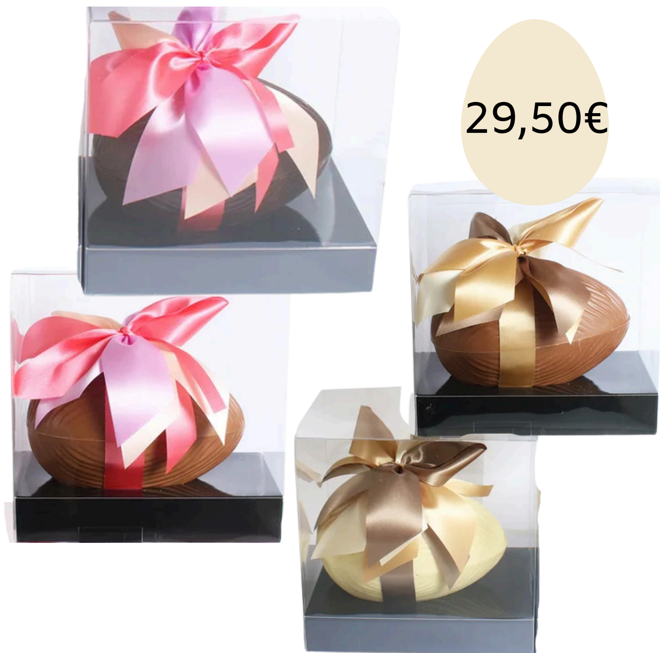
La coquille (15cm) garnie de ses petits oeufs