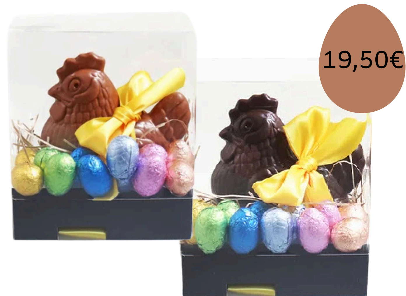
La poule (12cm) et ses petits oeufs