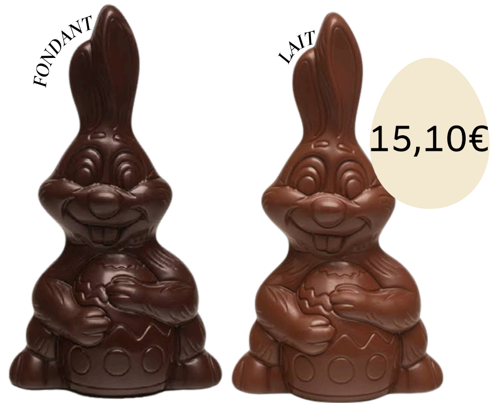
Le lapin et son oeuf (22cm)