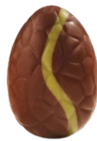
lait crumble pomme