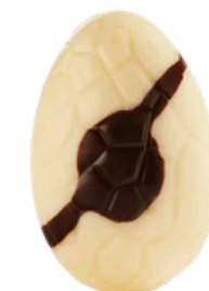
blanc dame blanche