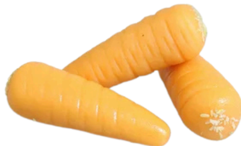
La carotte (25gr)