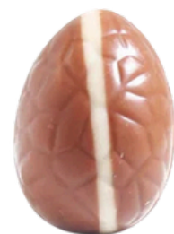
lait cookie dough