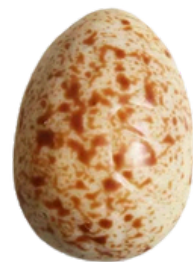
blanc praliné amandes