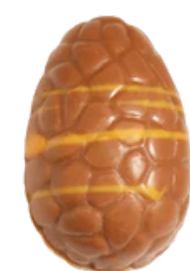
lait praliné croquant