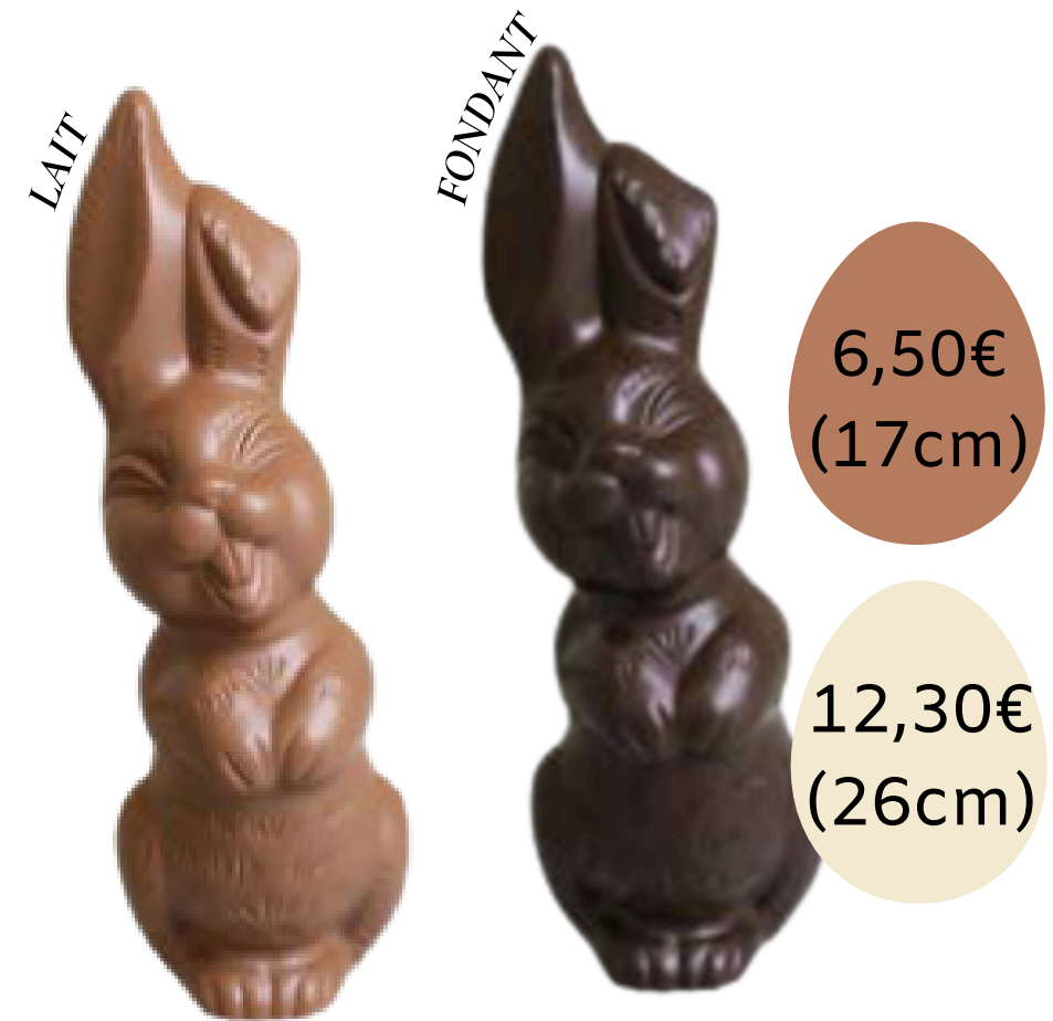
Le lapin rieur