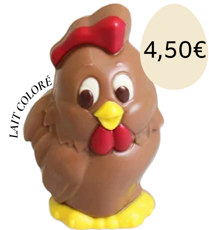
Le petit coq (9,5cm)