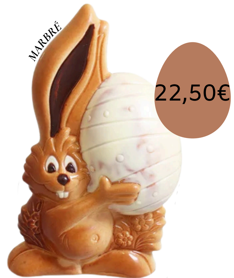
Le lièvre et son oeuf (22cm)