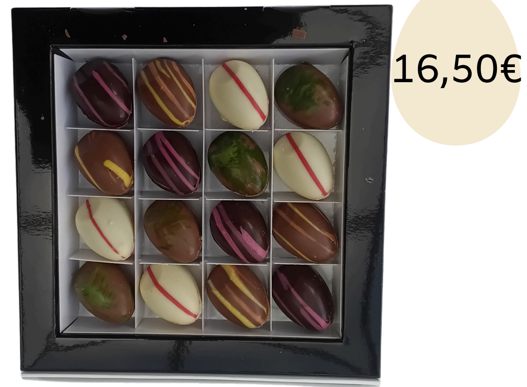
Le coffret des petits oeufs (noisette, cachuète, sésame et cajou)